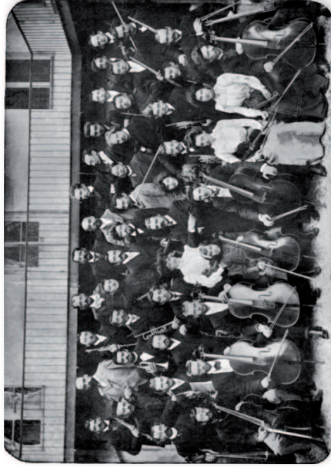
Schola Cantorum - 1901