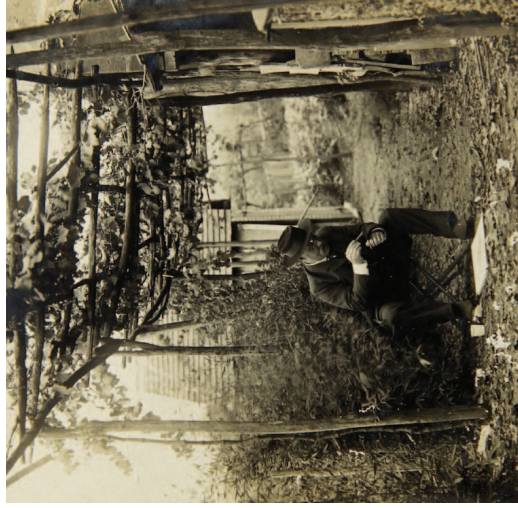
Fonds La Tombelle, collection particulière de M me Orsini

Nonostante gli sforzi di qualche pioniere (tra cui Camille Saint-Saëns), la riscoperta della musica barocca in Francia – in particolare di Bach e Rameau – non si colloca che alla fine della Terza Repubblica. Se i più moderni compositori francesi la rivendicheranno allora per tirare una linea sul romanticismo declinante, molti altri tentano una sintesi tra differenti età della musica francese. Scrivendo per il violoncello, La Tombelle e Duparc si ricordano della viola da gamba, senza tuttavia rinunciare alla pirotecnica resa possibile dai progressi organologici del secolo del virtuosismo.