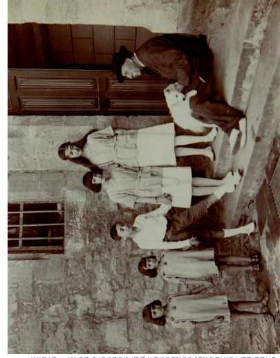
Fonds La Tombelle, collection particulière de M me Orsini

Pieces composed for several cellos make up a narrow repertoire, of which this concert proposes a few gems: La Tombelle's Suite for Three Cellos (1921), Reicha's Trio in E flat major (1807) and one of Offenbach's duos (c.1850). Often prompted by a pedagogical aim or simply for playing in public, to be heard in ensemble, cellists of the 20 th and 21 st centuries have had to resort to arrangements (like violists and harpists). Consequently, in the course of the evening listeners will be able to appreciate Fauré's famous Élégie and a few excerpts from Louis Vierne's Soirs étrangers adapted for cello quartet.