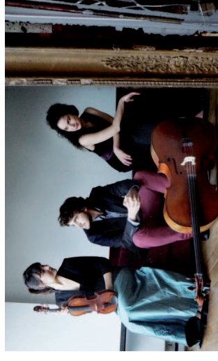
Trio Karéline

Vigorous and nervous in Duvernoy, elegiac and energetic in La Tombelle's writing, their respective four movements will be defended by the Trio Karéline.